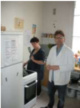
Atelier cuisine et repas partagé