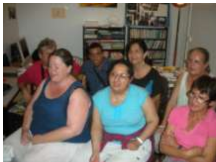
Moment de détente vocale Karaoké