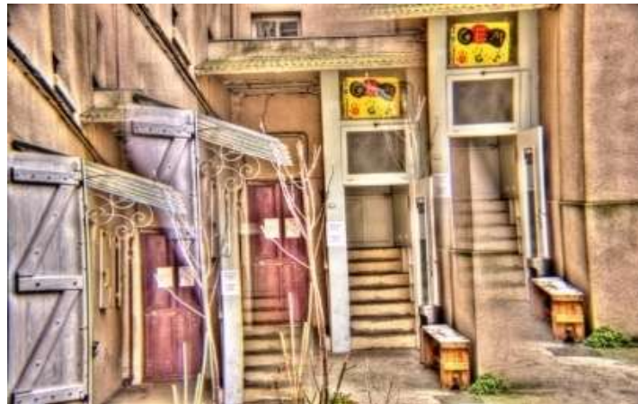
Entrée principale rue de la Coutellerie

Association à but non lucratif (loi du 1er juillet 1901). Pour les adultes en situation de fragilité psychique